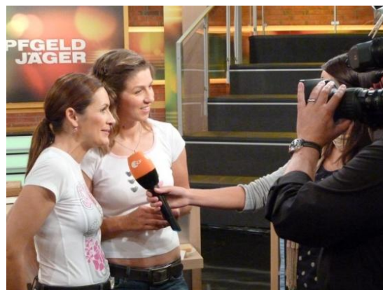
Interview nach dem zweiten Tag ...