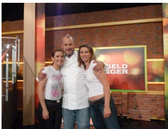
Abschiedsfoto mit Frank Rosin ...

Am ersten Tag haben wir es geschafft, Frank Rosin zu überzeugen. Am zweiten Tag ging alles anders ... Wenn ihr es wissen wollt, dann schaut einfach mal rein!