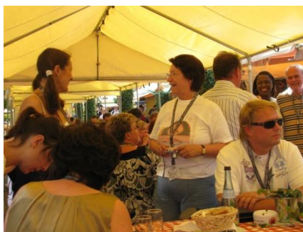
Weinfest in Hamburg