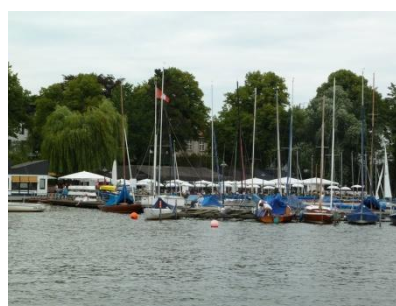
Sicht auf dem Bootssteg wo wir am Abend gemütlich feiern werden