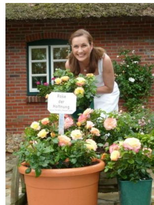
Ist sie nicht schön?

Als Künstler kann man heutzutage nicht mehr sehr viel bewegen. Aber mit guten Ideen – für die gute Sache – ist doch noch vieles möglich. Ich bin der Familie Kordes unendlich dankbar für die Unterstützung und bin mir sicher, dass diese Rose in vielen Gärten der Welt in Zukunft blühen wird. Ab Herbst 2011 ist sie für alle erhältlich! http://www.kordes-rosen.com