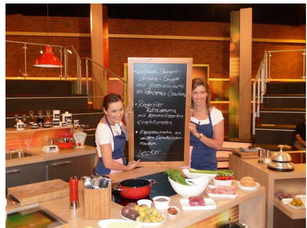
Die Zutaten stehen fest und wir überlegen uns was wir kochen! So, nun steht das Menü des ersten Tages fest:

„Weißwein-Stangen-Sellerie-Suppe mit Passionsfrucht an Pancetta Croutons